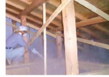
複層ガラスへの交換 天井の断熱改修

・併せて以下の工事等を行う場合はポイントを加算 バリアフリー工事：上限5万ポイント 省エネ住宅設備の設置：2万ポイント 耐震改修工事：15万ポイント※ リフォーム瑕疵保険加入：1万ポイント ※耐震改修工事はポイントを別途加算(上限45万ポイント)