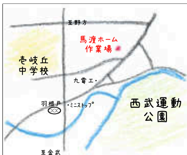
↑馬渡ホームの作業場地図↑

お世話になっております。 野方・生松台にお住まいの皆様と弊社の作業場で忘年会を開催したいと思っております。ご近隣の方とお誘い合わせの上是非! ご参加ください! 詳細はまたご連絡いたします。