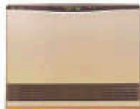
↑富士通のホットマン

今年秋が短く、いきなり冬の寒さがやってきましたね。急な気温の変化で体調など崩されていないでしょうか。急いで暖房をご準備されたご家庭も多いかと思いますが、冬になると馬渡ホームが毎年オススメさせていただいております「温水ルームヒーター、ホットマン」を今回、ご紹介させていただきます。