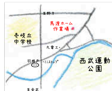
↑馬渡ホームの作業場地図↑

いつも大変お世話になっております。すみか新聞を配っております、野方・生松台にお住まいの皆様と地域の親睦もかねて弊社の作業場で忘年会を開催したいと思います。ご近隣の方とお誘い合わせの上是非!お気軽にご参加ください♪