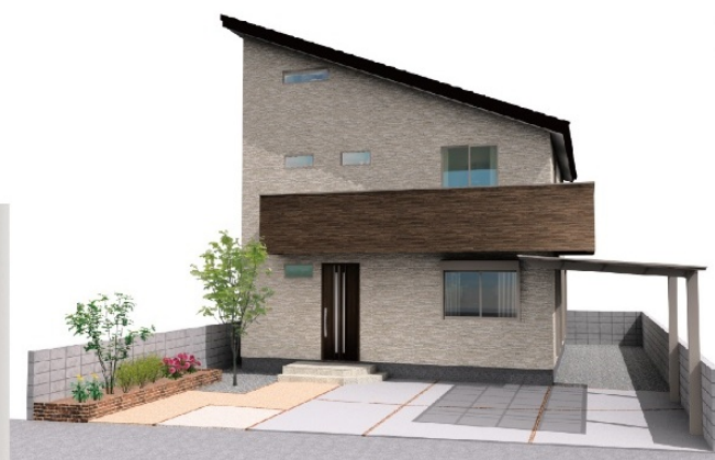
※工事中の住宅の完成イメージです。

これから日本の住宅は… 車の車検証のように、お家の燃費(住宅性能)が 分かります。この燃費(住宅性能)が、 夏涼しく・冬暖かい家の判断基準となります。 言葉だけでなく、そこにはしっかりとした 性能(家づくりの仕組み)があるんです! ぜひ、会場に聞きに来てね♪