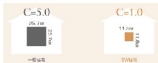
C値とは、床面積1㎡あたりの隙間面積です。弊社ではC値0.5cm 2 /m 2 以下を目標値としています。

住まいには見えない隙間がさまざまな箇所に存在しています。隙間が多いと、いくら暖房や冷房を行っても漏れてしまい、快適な室内環境を保つことができません。家の気密性が暮らし心地の差となって表れてきます。弊社では一邸一邸、気密測定を行い性能報告書にてご確認いただいております。