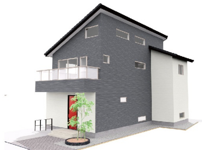
※工事中の住宅の完成イメージです。