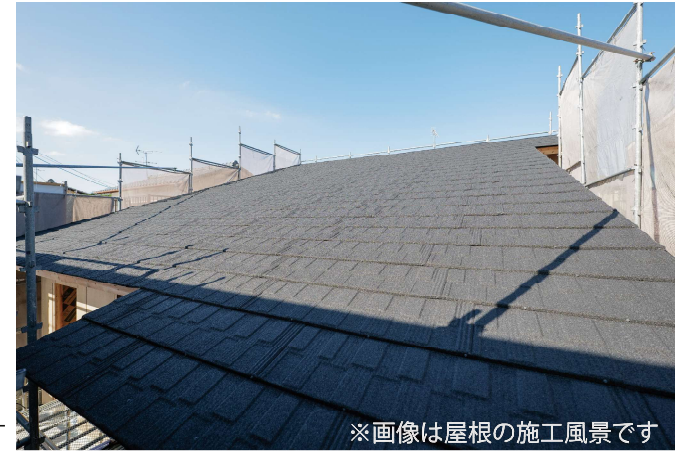
※画像は屋根の施工風景です