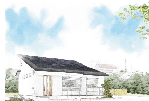
※画像は完成時のイメージです