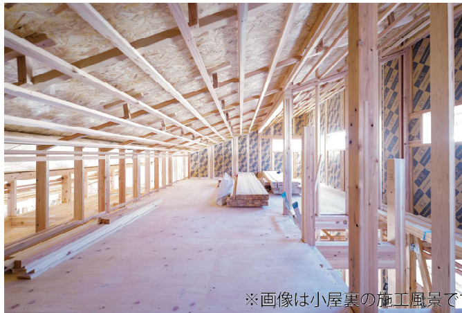
※画像は小屋裏の施工風景です