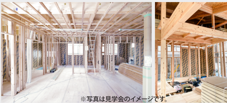
※写真は見学会のイメージです。

モノコック構造としての耐震性と、繰り返しの揺れに強い制振性のあるパネルを仕様としています。約30年の歴史の中で全半壊が1度も起きていません。