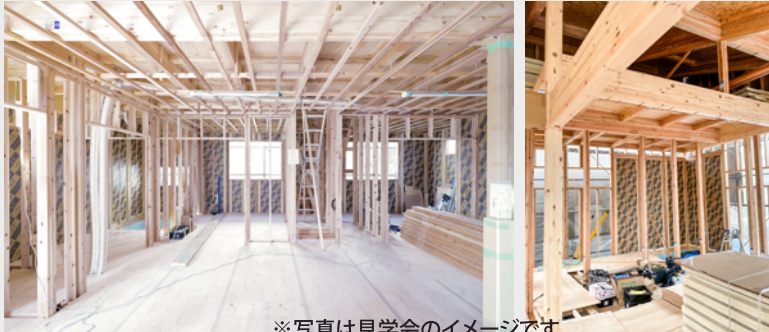
※写真は見学会のイメージです。

・省エネ・光熱費・快適に関わる「断熱」 ・音と空気の流れを防ぐ「気密」 ・良質な空気は家で買う時代 ・全館を小さな普通のエアコンで冷暖房